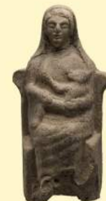
D. Di Pietrantonio, Borgo Sud , Einaudi Sala 39 - Veio