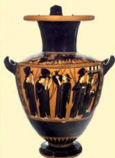
L. Ginzburg, Cara pace , Ponte alle Grazie Sala 4, Vulci