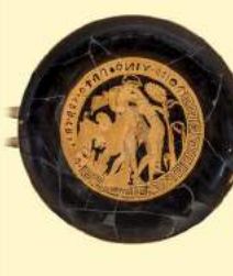
A. Urzi, Adorazione , 66thand2nd Sala 34, Falerii