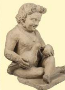
M. G. Calandrone, Splendi come vita , Ponte alle Grazie - Sala 5, Vulci