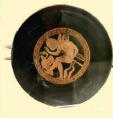
G. Caminito, L'acqua del lago non è mai dolce , Bompiani - Sala 13a, Cerveteri