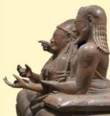
R. Venturini, L'anno che a Roma fu due volte Natale , SEM - Cerveteri, Sala 12