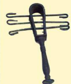
E. Trevi, Due vite , Neri Pozza Sala 23, Collezione Castellani