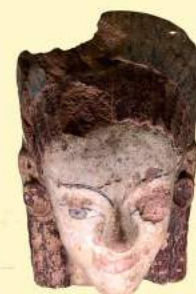
G. Mozzi, Le ripetizioni , Marsilio Sala 13a, Cerveteri