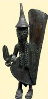
T. Ciabatti, Sembrava bellezza , Mondadori - Sala 2, Vulci