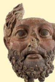
D. Petruccioli, La casa delle madri , TerraRossa - Sala 36, Falerii