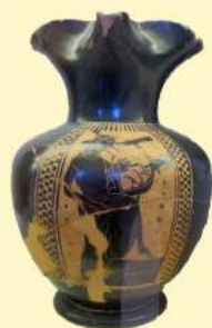
A. Bajani, Il libro delle case , Feltrinelli Sala 23, Collezione Castellani