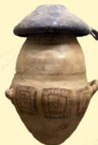
E. Bruck, Il pane perduto , La nave di Teseo - Sala 37, Veio